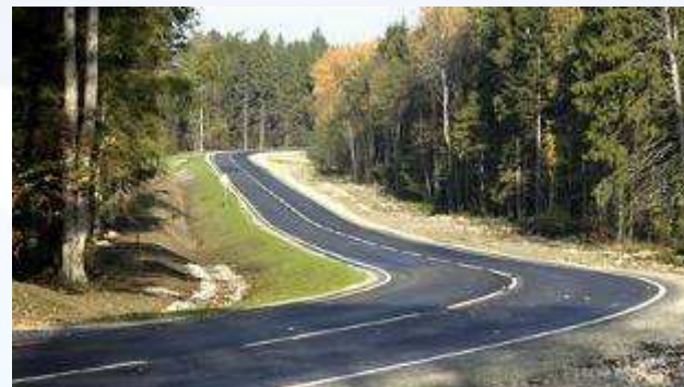
Pildil: tee-ehitus, AS Aspi