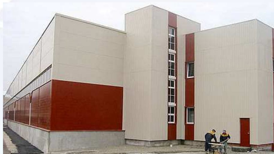
Pildil: Õlletehas Lvivis Ukrainas, ehitaja Eurocon Ukraine LLC