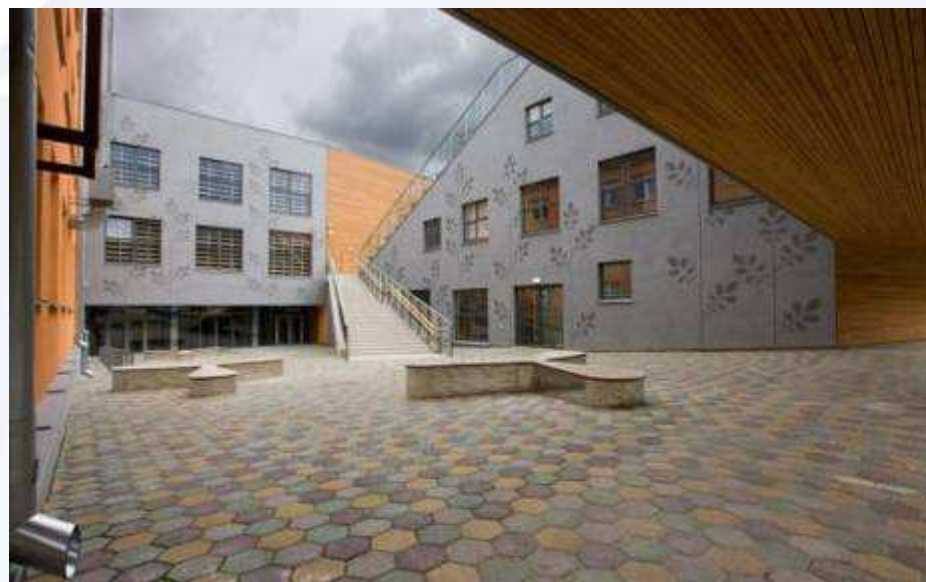
Pildil: Kesklinna Kool Tartus, ehitaja AS Linnaehitus