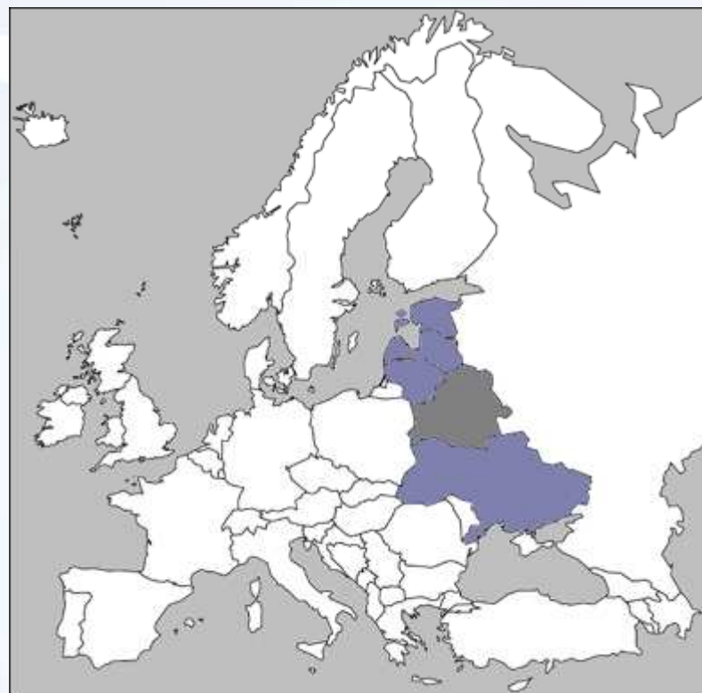
Nordecon International 2013