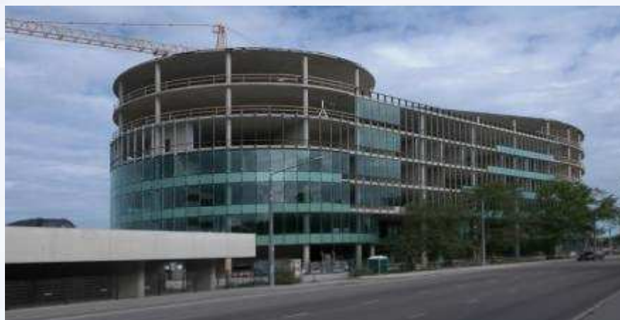
Pildil: Eesti Raudtee peahoone ehitus, peatöövõtja AS Eesti Ehitus, betoonitööd OÜ Mapri Projekt